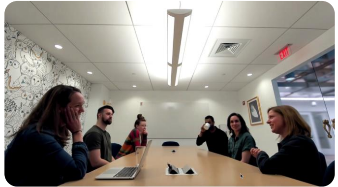
Utilisation classique avec positionnement face à la salle