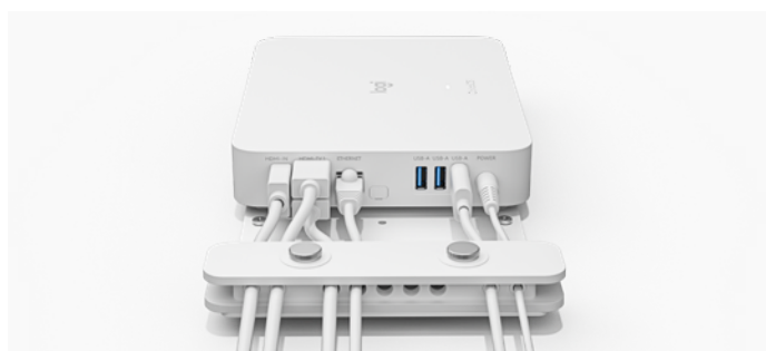
support pour dispositif Logitech avec RoomMate

Une fixation de regroupement des câbles réduit la tension des câbles, notamment USB, HDMI, d'alimentation et réseau, et empêche ainsi qu'ils se débranchent. La fixation en deux parties est surélevée pour une plus grande flexibilité et une tension moindre.