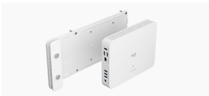
support pour dispositif Logitech avec RoomMate

Installez et fixez RoomMate ou tout autre dispositif à l'aide des systèmes de fixation VESA standard de 75 mm ou 100 mm.