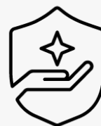
3 ans, enlèvement et retour UM917E